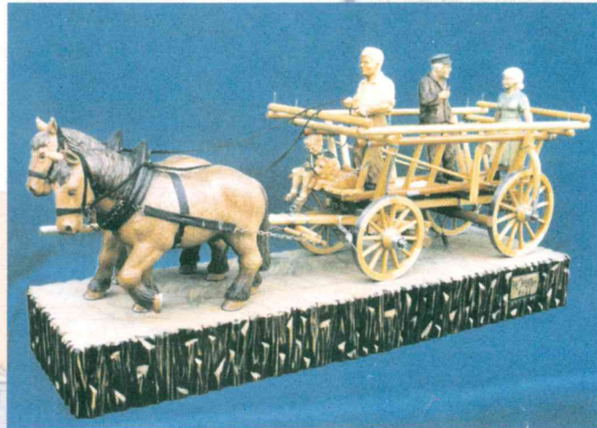
Ausfuhr zur Ernte