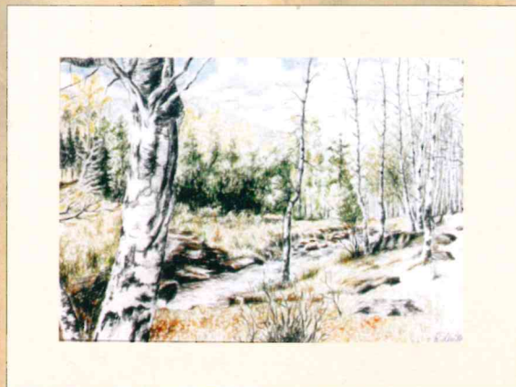
Der Birkengarten, Buntsiftzeichnung, 1948