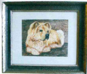
Hund (Farbstift )