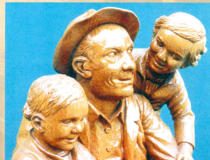
Großvater mit Enkeln (Detail) Eichenholz, 1961