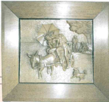
Der Überfall (Relief)