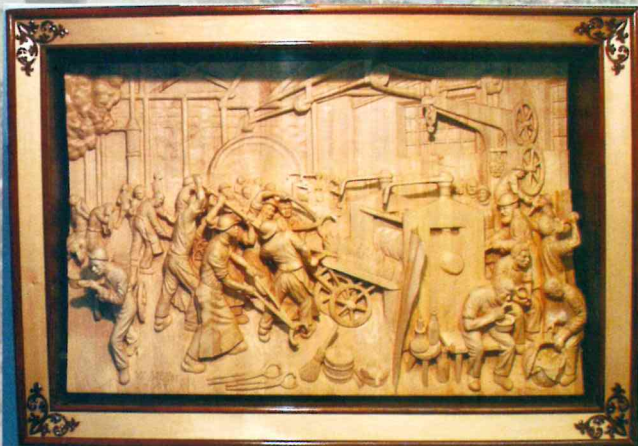
Walzwerk (Relief nach dem Gemälde von A. Menzel)