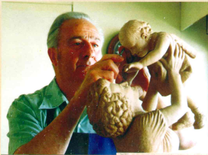
Der Künstler bei der Arbeit an der Plastik Mutter mit Kind, Eichenholz, Höhe 1,10 m