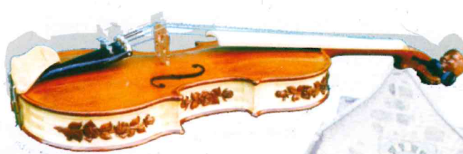
Geige aus nicht üblichen Holzarten für den Geigenbau gefertigt